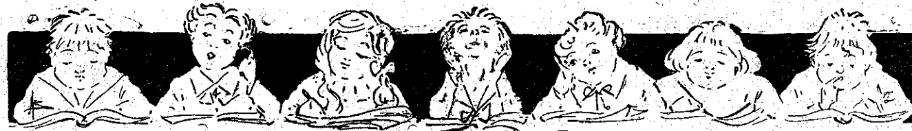
Ίδε τον Ό-θηγόν του