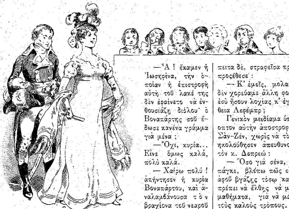
« Η εισόδός της έκαμεν αίσθησιν ». (Σελ. 80, στ. γ'.)

— Κυρία, άπεκρίθη ο μικρός Κορμάς, έπέστρεψα σήμερα με τον ύπασπιστήν Ζυνώ.